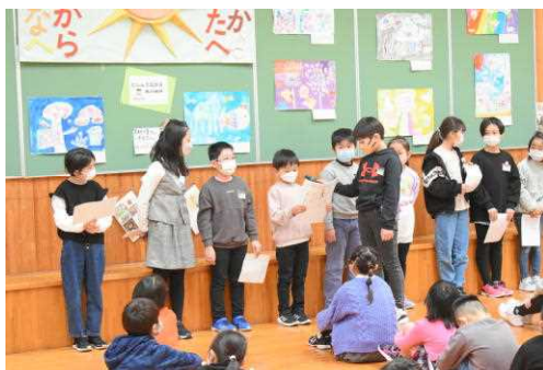
各学年の発表。雪寄せをがんばったという発表もありました！

集会を通して、冬休み中の互いのがんばりやよさを認め合い、1年間のまとめをがんばろうという気持ちを高めることができました。