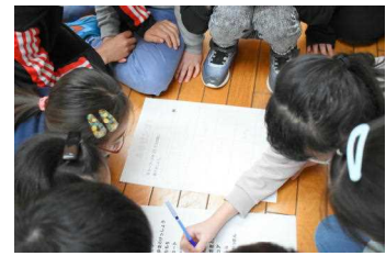
進行は「たいようくん委員」が務めました。