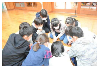
「冬休みビンゴ」の様子。真剣に相談しています。