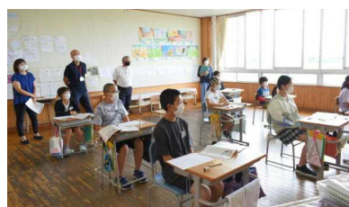
6年道徳 ピアノの音が・・・