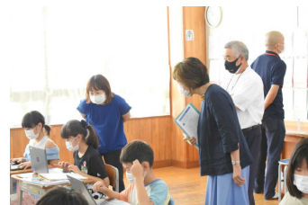
3年社会 働く人と私たちの暮らし