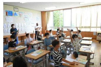
4年道徳 私の見付けた小さな幸せ