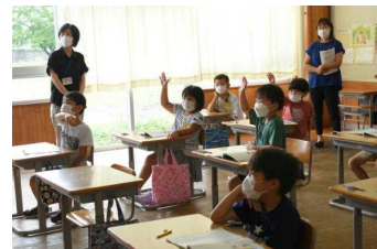
1年国語 たのしいな、ことはあそび