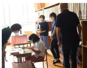
あゆみ国語 季節の言葉(夏)