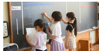
2年算数 ひっ算の仕方を考えよう