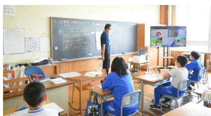
5年算数 整数の性質を調べよう