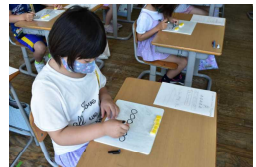
自分で考える1年生