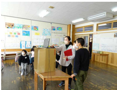
〈各教室の状況チェック〉

もちろん6年生主役の行事ですが、『主催』は“たったの9人”の5年生！タブレットを使いこなしているのも、卒業生の写真や音楽の合成なども、とっても上手です。司会、映像のチェック、各教室の様子を観察など、本当に全員が一丸となって、一人一人が力を発揮しながら、“されど9人”がチームとしての最高の演出がプレゼントできました。