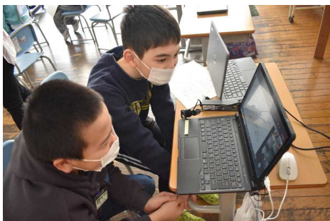
〈映像確認ディレクター？〉