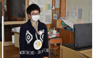
〈委員長からの引き継ぎメッセージ〉