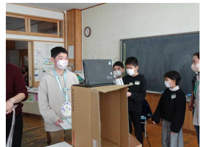
〈6年生を一つずつ紹介〉