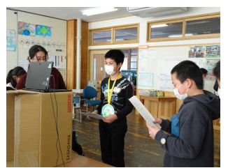
〈在校生からのプレゼントを淳美先生からもらって〉 〈ありがとうのコメント〉