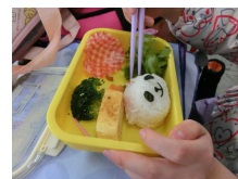
スキーより楽しみ