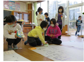
おもちゃパーティー

学校教育目標「夢に向かって 心豊かに たくましく生きる子ども」 ～“自分で考え みんなと創る” 楽しい ふるさとの学校～