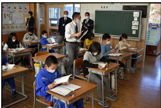
～3年生の国語の授業～ 「食べ物のひみつを調べて書こう」 『すがたをかえる大豆』より