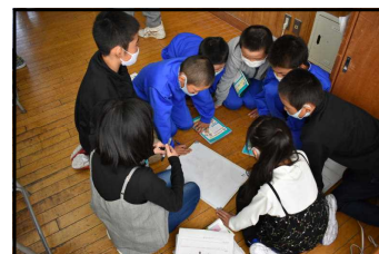
“グループでしぼる”