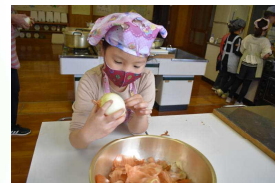
タマネギニモ負ケズ

学校教育目標「夢に向かって 心豊かに たくましく生きる子ども」 ～“自分で考え みんなと創る” 楽しい ふるさとの学校～