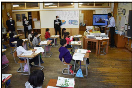
～1年生の国語の授業～ 「いろいろなじどう車のひみつを みつけよう」『じどう車くらべ』より

これまでの、バスやトラックの学習で身に付けた力を活用して、クレーン車について書かれた文を絵とつなげたり、動画を見たりして考えを深めていきました。