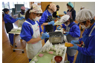
5年生はおにぎりづくり