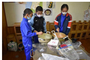
6年生と4年生はなべづくり