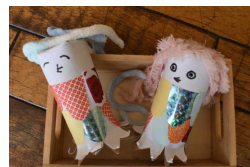
2年桃子さんのあまびえ

学校教育目標「夢に向かって 心豊かに たくましく生きる子ども」 ～“自分で考え みんなと創る” 楽しい ふるさとの学校～