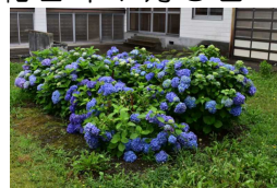
横堀小のハート紫陽花

学校教育目標「夢に向かって 心豊かに たくましく生きる子ども」 ～“自分で考え みんなと創る” 楽しい ふるさとの学校～