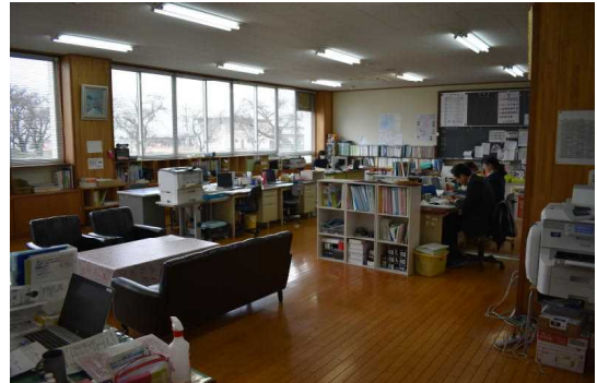
職員室の配置も変わりましたよ！