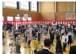
思い出のあのメロディー

学校教育目標「夢に向かって 心豊かに たくましく生きる子ども」 ~“自分で考え みんなと創る” 楽しい ふるさとの学校~