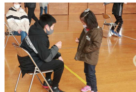
6年生とジャンケン

学校教育目標「夢に向かって 心豊かに たくましく生きる子ども」 ～“自分で考え みんなと創る” 楽しい ふるさとの学校～