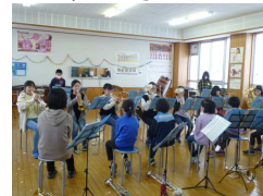
器楽部6年生を送る会

学校教育目標「夢に向かって 心豊かに たくましく生きる子ども」 ～“自分で考え みんなと創る” 楽しい ふるさとの学校～