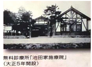
無料診療所「池田家施療院」 (大正5年開設)