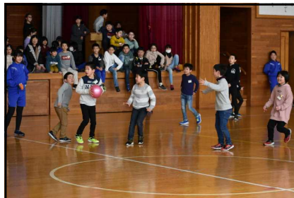
下学年の部「力を合わせて」