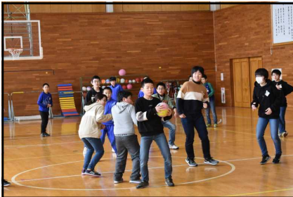
上学年の部「俺が守る！」