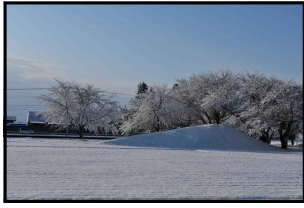
冬らしいくじら山