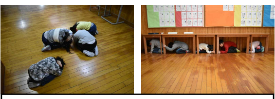
13時10分 昼休み、予告なしの訓練

23日(木)、大仙市の第6回シェイクアウト訓練が市内一斉に実施されました。 本校では午前中に1度、担任の先生と一緒に訓練した後で、子どもには教えないで昼休みにいろいろな場所で突然に起きた場合の訓練を行いました。 予告なしでも、近くの友達と一緒に放送に耳を傾けて、安全な場所を見つけて静かに身を守ることができていました。 でも、中には放送中もおしゃべりがまんだできない子どももいて、きびしく指導しました。こういう命を守る学習に真剣に取り組む心をしっかりと育んでいきたいものです。 大人のいうことを素直に聞くことも、防災教育で身に付けたい大事な力の一つです。