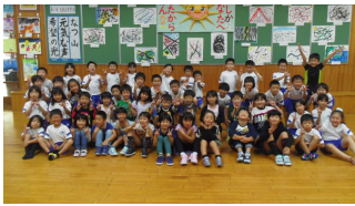
1年生・高梨小との交流