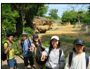
自由行動・動物園でサイと