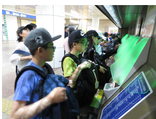
どの切符買えばいいの?

少し悩む場面や、困ってしまうこともあったようですが、みんなであきらめずに、知恵を絞って解決したことがよい思い出になったようです。そして、保護者の皆さんやお世話になった方々への感謝の気持ちをしっかりと持ち帰る幸せな子どもたちです。そして、保護者の皆さんやお世話になった方々への感謝の気持ちをしっかりと持ち帰る幸せなリーダーです。これから横堀小学校で過ごす日々が、修学旅行の時間のような、ワクワクして楽しい時間になることを願っています。毎日が修学旅行気分“楽しい学校”っていいですね。