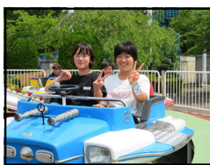
ベニーランドでピース