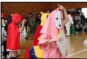
いろいろな顔がありました みんなが笑顔になりました。