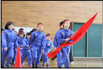
優勝めざして、 全力！協力！