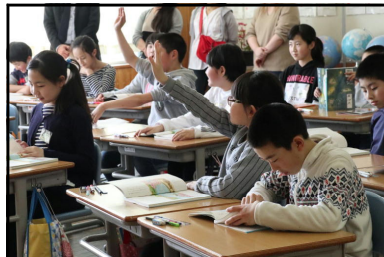
5年生・国語・「あめ玉」の音読