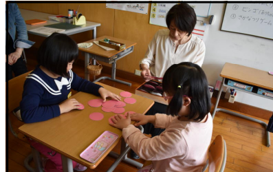
あゆみ・学活・ピンゴでなかよし