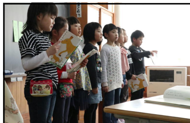
2年生・国語・音読発表会