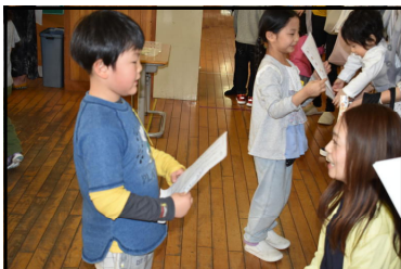
1年生・国語・じしょうかい