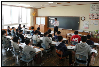
6年生・算数・対称な図形

入学したばかりの1年生には初めての小学校での参観日。落ち着いた中にも、笑顔がいっぱい、おうちの皆さんとのふれあいっぱいの、春らしい温かな授業でした。登校した児童、すべてのご家庭の皆さんがご来校されるという、参加率100パーセントにびっくり！！でした。さすが、横堀。やっぱり横堀。その後も、PTA総会、学年懇談、役員会という、午後から4コマの密集した日程でしたが、ずっとずっと、温かなご支援のまなざしと自然なほほえみがうれしかったです。「おだやかな横堀」「心が開かれている横堀」「いい学校、横堀小」この三本の矢？に、ますます自覚と誇りを深めることができました。ありがとうございました。