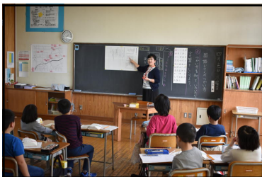
3年生・国語・辞典の使い方