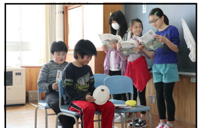
4年生・国語・音読発表会