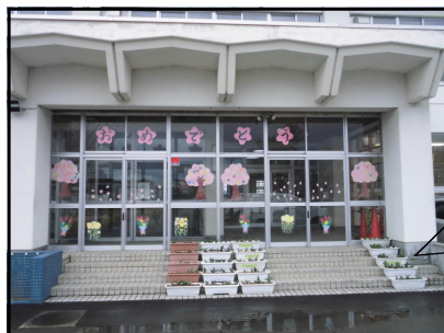
玄関はすっかり「おめでとうの春」