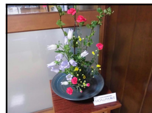
玄関を入ると すてきな 春の花