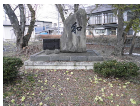
庭には ふきのとうが いっぱい