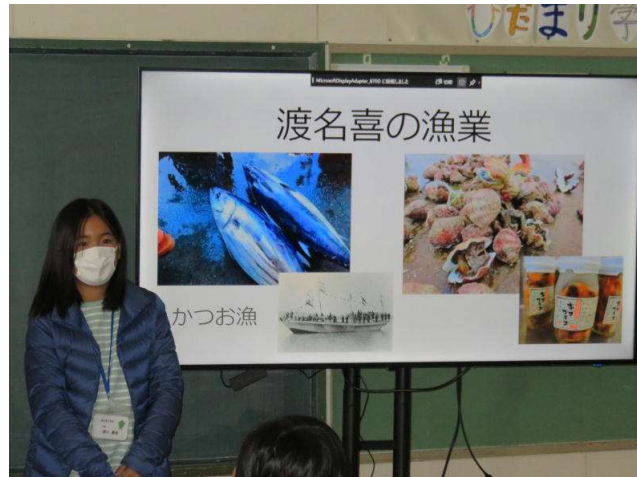
↑ 渡名喜島についてプレゼンしてくれました