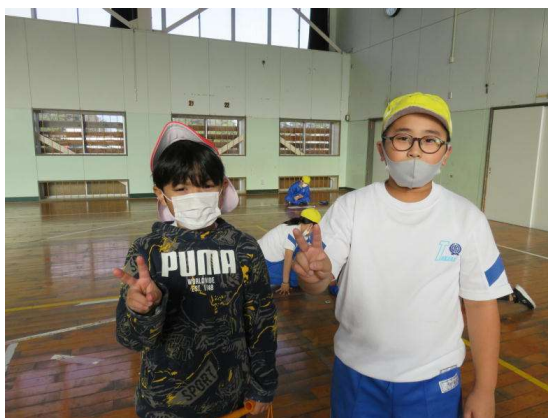
↑ 僕たち同じ名前「○○○」です！