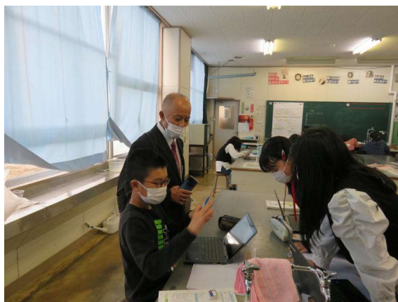
↑ 6 松理科「教育長さんに考察結果を説明中」