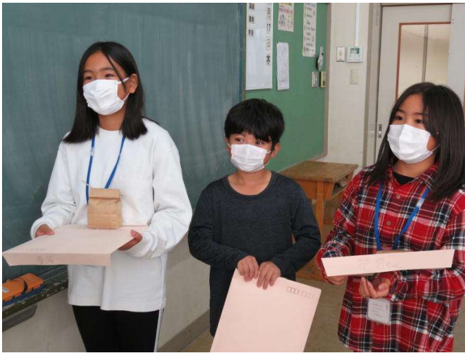
「左から：〇〇さん・〇〇さん・〇〇さん」

「上原〇〇さん」から 今回高梨小に来ていろいろなことを学びました。高梨小の子たちは、明るく人なつっこくて、だれでも友達になれるような子たちで、なんでこんなに仲よくしてくれるんだろうと思ったときに、高梨小の子たちは前もこうやって友達をつくらうとしていたから、きのう、今日も友達をつくれたのかなと思いました。だから渡名喜でもこうやって友達をつかっていきたいです。 2日間本当にありがとうございました。