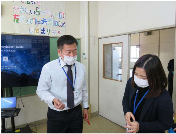
↑ 教員同士も交流しました