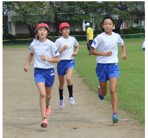
↑ 6年女子トップ争い