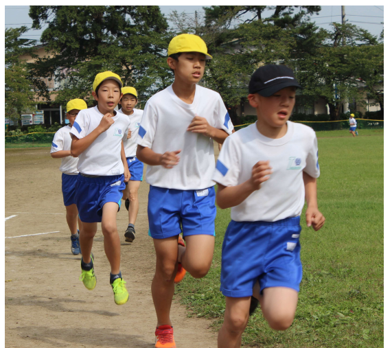
↑ 5年男子トップ争い