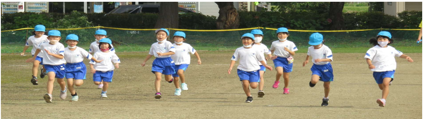
1年女子スタートダッシュ↓