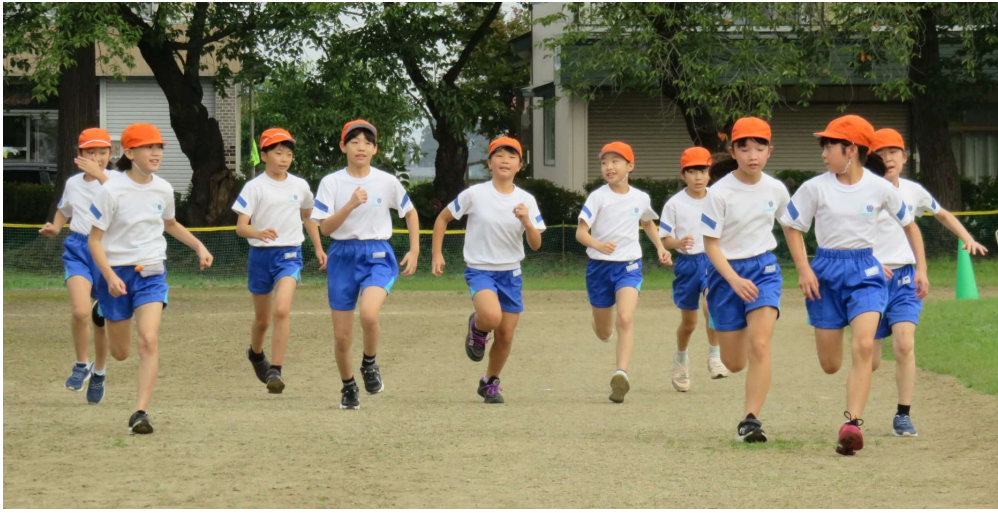
← 4年女子スタートダッシュ