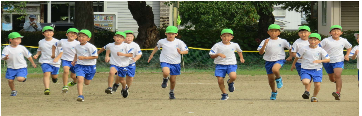
↑ 2年男子スタートダッシュ