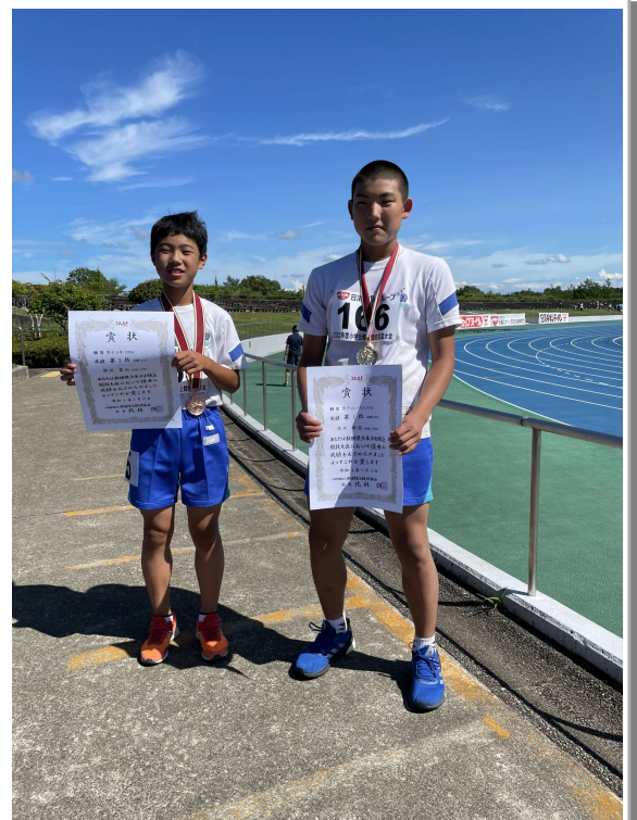
男子コンバインドB第1位（全国大会出場）