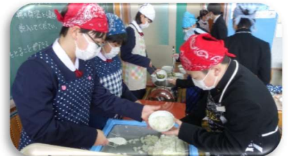
1年生給食スタート