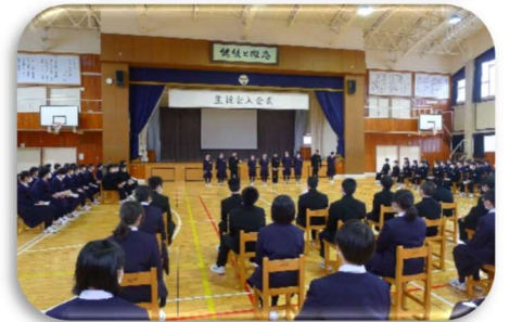
生徒会入会式と歓迎の舞