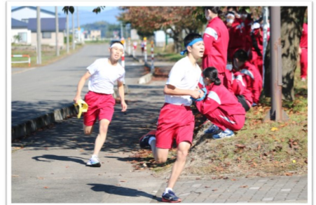
秋晴れの下、校内駅伝大会でのデットヒート(中継点直前)