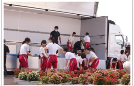
プランターの積み込み、生徒交流は無しで、花をコンテナ車で運びました