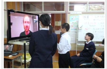
Zoomでかりフォルニアで太田をつなげて、1年生が交流しました