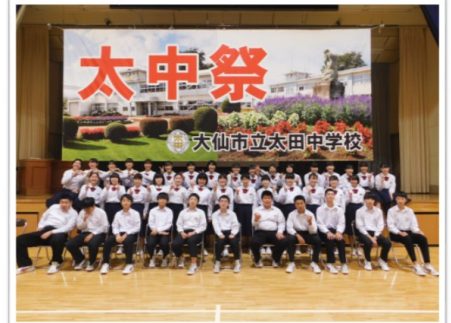
様々な制約の下、3年生は最後の太中祭をやりました。