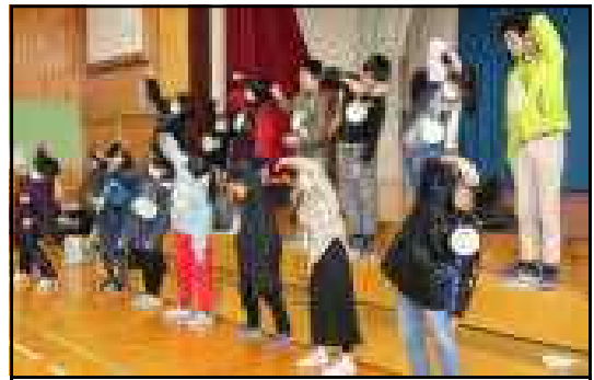
6年生と一緒にラジオ体操第3