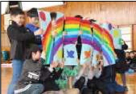
みんなで描いた絵を見てね!