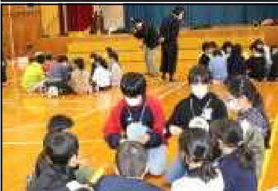
6年生とプレゼント交換