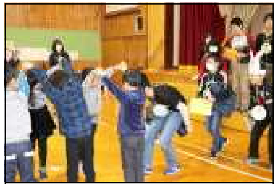
最後は6年生が花道を通して退場

5年生がリードして、全校のみんなが6年生に感謝の気持ちを伝えることができた、心温まる素敵な集会となりました。