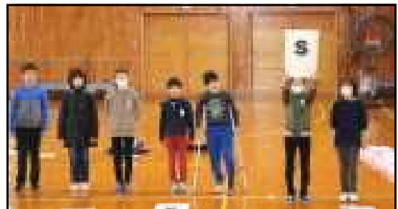
6年生一人一人に感謝のメッセージ