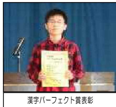
漢字パーフェクト賞表彰

大型の台風19号が近づいています。 暴風雨になったら不要不急の外出は 控えましょう。