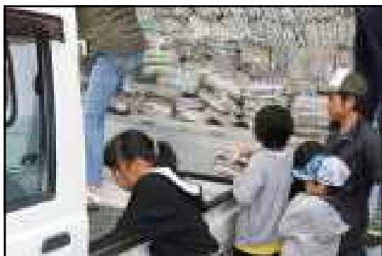
子どもたちも立派な働き手

21日(土)は、各地域より古紙・段ボールや空き瓶などを回収いただき、ありがとうございました。2回目の回収もたくさん集まりました。子ども達も大人と一緒に、本気で働く姿に清々しい気分になりました。