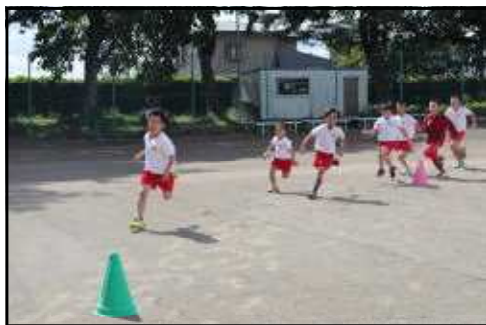
練習から本気モード