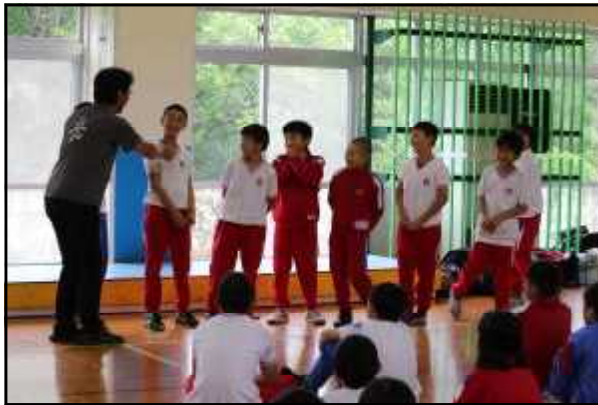
仲間意識ができた「PA活動」

大自然の中でみんなで楽しく活動し、4つのめあてが達成できた有意義な合同宿泊体験学習になりました。保護者の皆様、準備等へのご協力ありがとうございました。