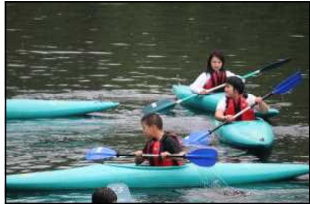
パドル操作にも慣れて「カヌー体験」