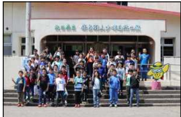
最後は全員で記念撮影