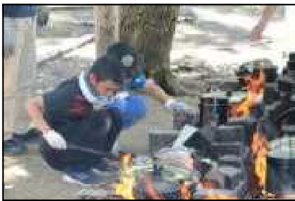
煙に負けず「野外炊飯」