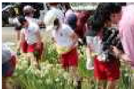
ねぎぼうずを取る4年生

将来, 「あなたのふるさとの自慢は何ですか?」と聞かれたときに, 「伝統野菜の横沢曲がりねぎです。学校で育てたことがあります。」とすぐに答えることができれば, 素敵だなと思います。「甘くて柔らかい」という曲がりねぎのよさや伝統をつなぐためのお手伝いが学校でもできたら, そして, ふるさと太田に誇りをもてる子どもたちになってくれたらと願っています。