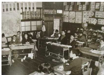
授業時間の様子(昭和45年)

現在の1年生が3年生になる年に、太田南小学校は、150周年の節目を迎えます。諸先輩が築き上げてきた素晴らしい伝統を引き継いでいけるように、これからも全校みんなで力を合わせて、何事にもがんばっていきたいと思います。