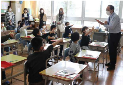
3年「きつつきの商売」