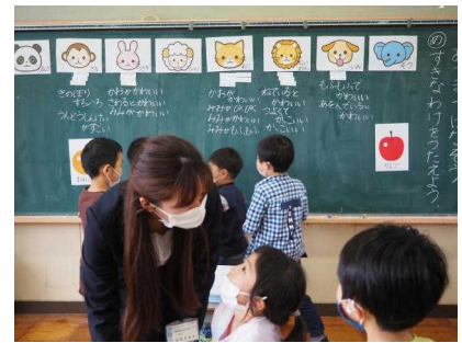
1年「あつまってはなそう」

昨日のオープンデーから、保護者の皆様の学校に寄せる期待をひしひしと感じております。今後も子どもたちが健やかに成長できるよう、学校教育目標の達成をめざし、職員みんなで励ましていきたいと思っております。今年度もご協力お願いいたします。