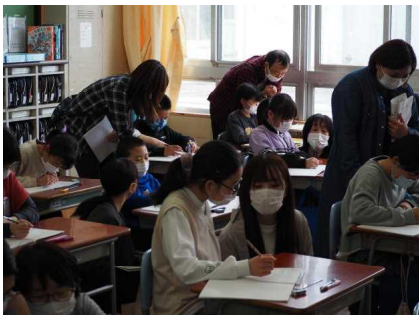
6年「生活時間をマネジメント」