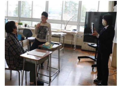
きらり「教えて、あなたのこと」