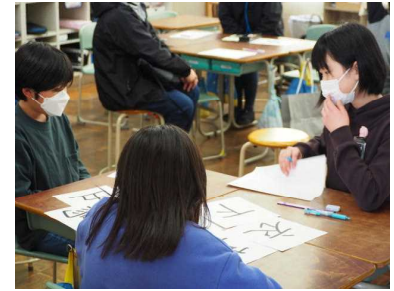
5年「漢字の成り立ち」