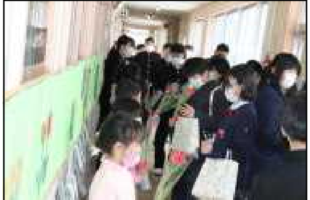
下級生からお花のプレゼント