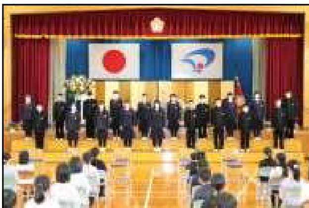
晴れやかな呼びかけ