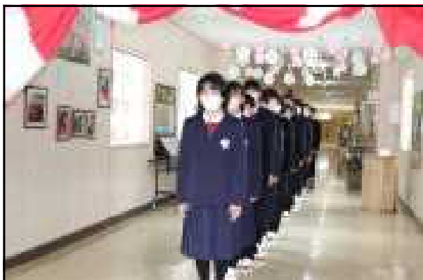
いよいよ式が始まります