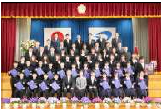
ご家族と一緒に集合写真