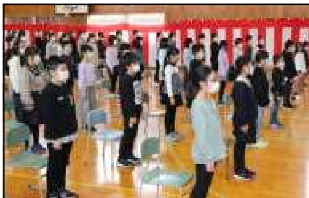
式に参加した4・5年生も立派でした