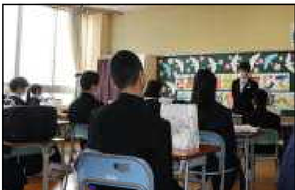
担任の思いを伝える最後の学活