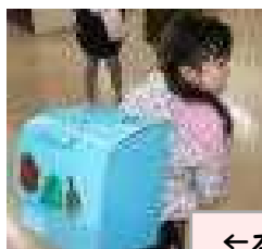
←本物そっくりのお手製ランドセル