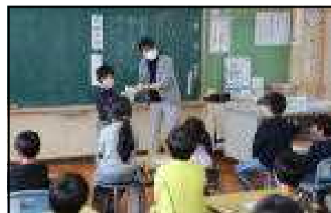
1年生と一緒に勉強する年長さん