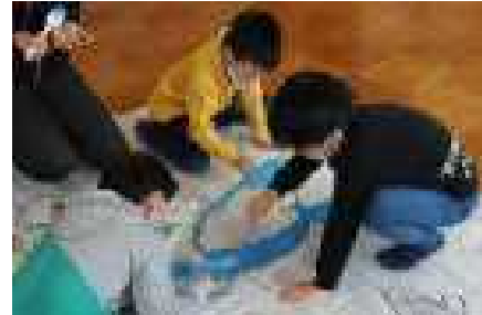
真剣に絵付け作業をする1年生

完成披露会は2月3日に行う予定です。子どもたちと完成の喜びを味わいながら、紙風船を空高く揚げたいと思っています。