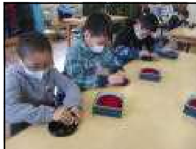
つやを出すために磨いています

4年生は、ふるさと村へ出かけました。最初に、プラネタリウムで、秋から冬の星座を観察しました。星の動きや見つけ方がよく分かりました。次は、桜皮細工の手作り体験。小箱に桜の皮をデザインしながら貼り付け、布で磨いて完成。きれいに仕上がった作品を見て、伝統工芸の素晴らしさを実感していました。