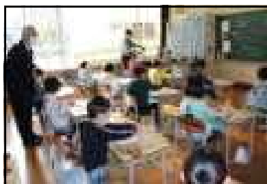
自分の思いを形に(2年図工)

「どの学級も、子どもたちと担任の信頼関係が感じられ、落ち着いて学習に取り組んでいる」「子どもたち一人一人を大切にする授業作りが素晴らしい」とお褒めの言葉をいただきました。