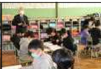
資料を選んで読み取る(5年国語)