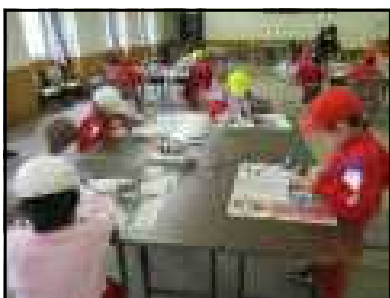
みんな真剣に製作中