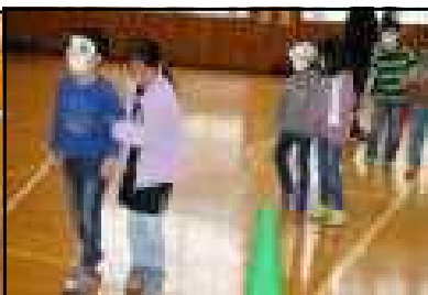
目が見えないと不安だね

大仙市社会福祉協議会、福祉のまちづくり委員の方々のご指導のもと、バリアフリー教室を行いました。車イス体験や、目隠しをして歩く体験、重りをつけて箸を使う体験などをし、体の不自由な人がどんなことに困っているか実感することができました。そして、自分たちにできることを考えるいい機会になりました。