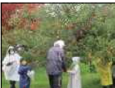
真っ赤なりんごがたくさん

あられが降る悪天候でしたが、1年生は農業科学館に出かけ、様々な活動を楽しんできました。松ぼっくりなどを使った工作では、アイデアいっぱいの作品を熱心に作っていました。晴れ間をみて、りんご狩りに挑戦!今が旬の「ふじ」をくるくる回して上手にもぎ取っていました。係の方の話をしっかり聞ける立派な1年生でした。