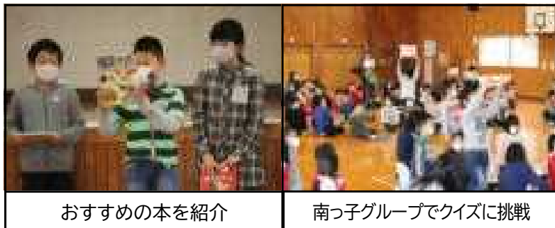
おすすめの本を紹介

図書委員会主催の読書集会が行われました。題して『新しい本がいっぱい! 秋の読書まつり』です。最近、学校に新しい本がたくさん入りました。その中から図書委員がおすすめの本を紹介したり、〇×クイズを出題したりして、本への興味がわく集会でした。本に親しむ子がたくさん増えることでしょう。