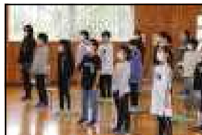
校歌をのびやかに歌いました