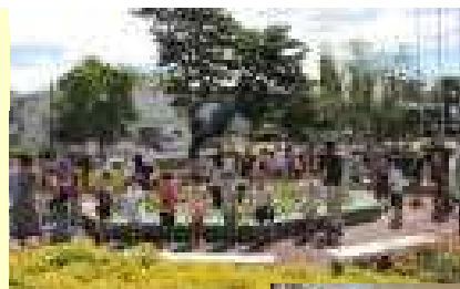
撮影前の子どもたち

写真がお手元に届きましたら、「県民歌と校歌の素晴らしさ」と「本校卒業生である倉田政嗣氏の偉業」を話題にしていただけたいと思います。