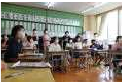
英語をじっくり聴く6年生

昨日は、指導主事の先生に、6年生の外国語科を見ていただきました。自分たちが行きたい国を英語で紹介しあう活動でした。6年生は少し恥ずかしそうにしながらも、各国の名所や食べ物の英単語を覚え、ペアで会話する楽しさを味わっていました。