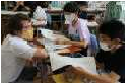
ALTの先生からのアドバイス