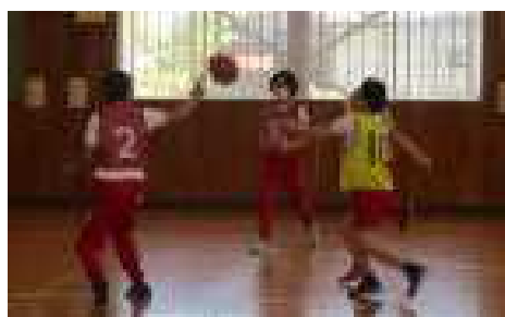
「ボール、こっちにパスして！」