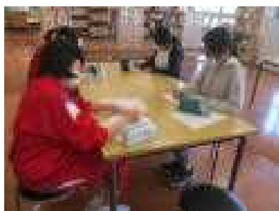
イラストに熱中して無言