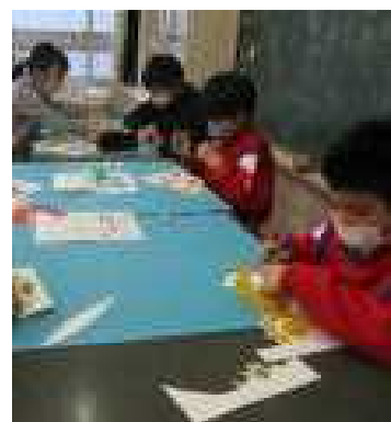
ペーパークラフトに夢中