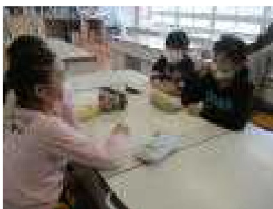
「手芸で何を作ろうか？」