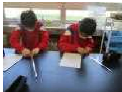
アルミ板でホイッスル作り

クラブは子どもたちにとって楽しみにしている活動の一つです。他の学年の人と一緒にあって、自分たちがやりたいことを思う存分できるからです。4年生以上の子どもたちが、下の表にある5つのクラブのどれかに所属し、昨日から活動がスタートしました。みんなのアイデアで楽しいクラブ活動にしてほしいと願っています。