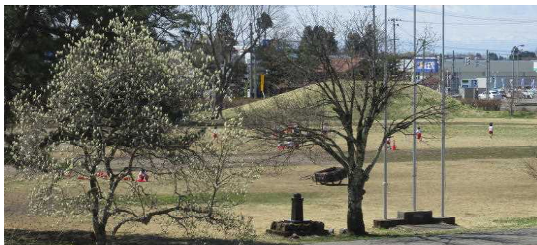
校庭にある木蓮の花が咲きました。桜の開花ももうすぐです。グラウンドでは子どもたちが元気いっぱい遊んでいます。