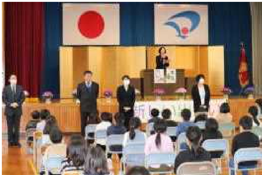
ドキドキの学級担任発表！ どうぞよろしくね！