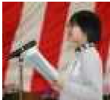
「歓迎の言葉」を發表した 6年生の〇〇〇〇さん