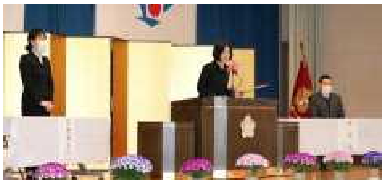
新しい先生方をお迎えして 今年度スタート！