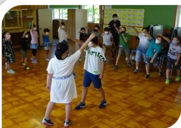
6月 オリエンテーション テーマの発表