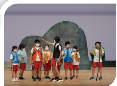
10月 ドンパルでの会場練習