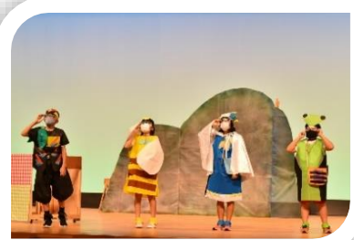
10月 音楽劇を成功させよう！