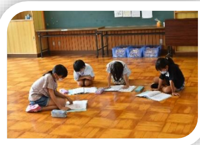
8月 台本の読み合わせ