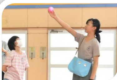
7月 役のオーディション