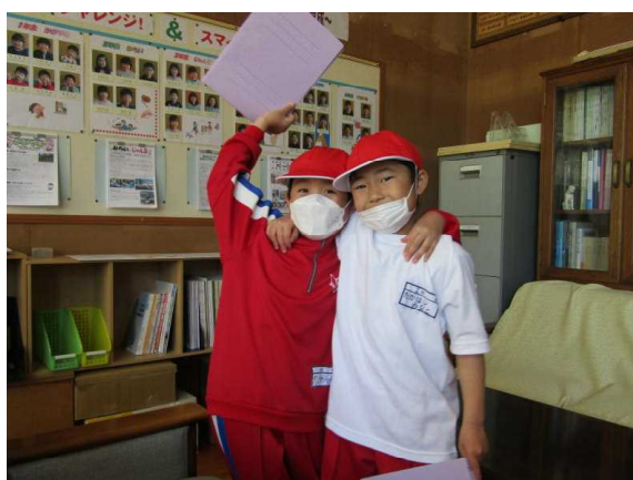
【1年生は初めてのチャレンジ!】

月曜日から「詩の暗唱週間」が始まっています。朝、2時間目後の中休み、昼休みに児童が校長室に来て、課題の詩を暗唱します。課題の詩は12編あり、おまけも2編あります。5月は詩を2つまでチャレンジできることにしています。子どもたちは書いて覚えたり、友だちと練習したりして校長室に来ています。全部合格できるように頑張してほしいものです。