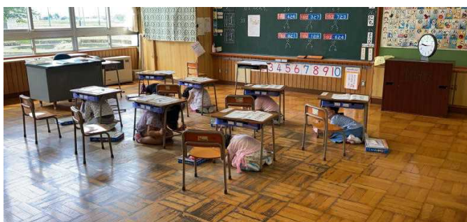
1年生もしっかりと 机の下にもぐることができました