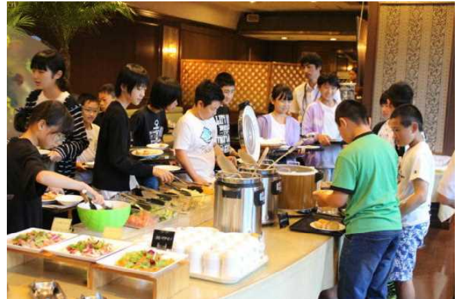
ホテルの豪華夕食