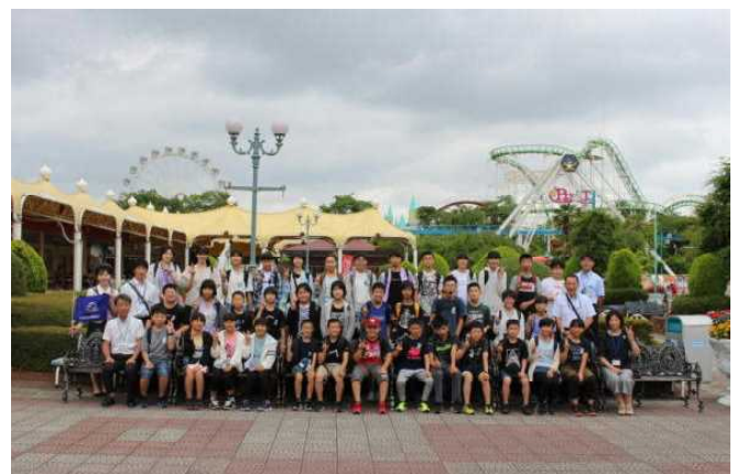
三校合同で「イエ～イ！」