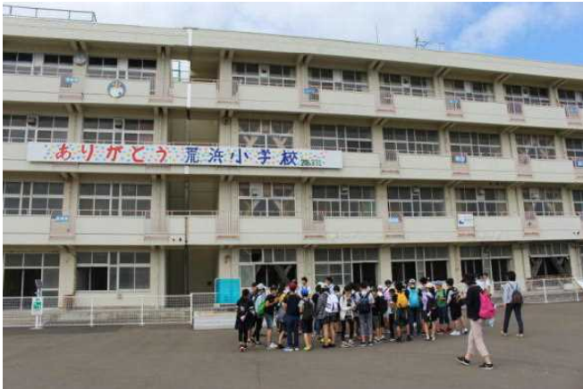
被災した荒浜小学校

〇〇さん～心に残ったことは、豪華ホテル。楽しかったことは、ベニーランドで絶叫系に乗ったこと。 〇〇さん～心に残ったことは、職場体験。なかなかできない体験ができたこと。楽しかったことは、うみの杜水族館。 〇〇さん～心に残ったことは、職場体験。仕事は難しいと感じた。楽しかったことは、ベニーランドでパイラットに乗ったこと。 〇〇〇さん～心に残ったことは、職場体験。お客さんが来てくれて楽しかったけど、対応や声を出すのが大変だった。楽しかったことは、ベニーランドでジェットコースターに乗ったこと。 それぞれ、思い出に残る修学旅行になったようです。