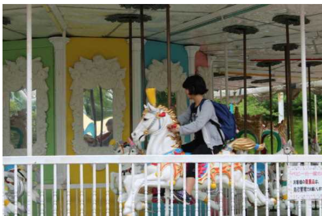
メリーゴーランド