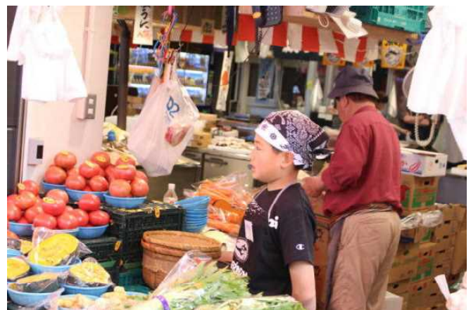
職場体験「いらっしやいませ～！」