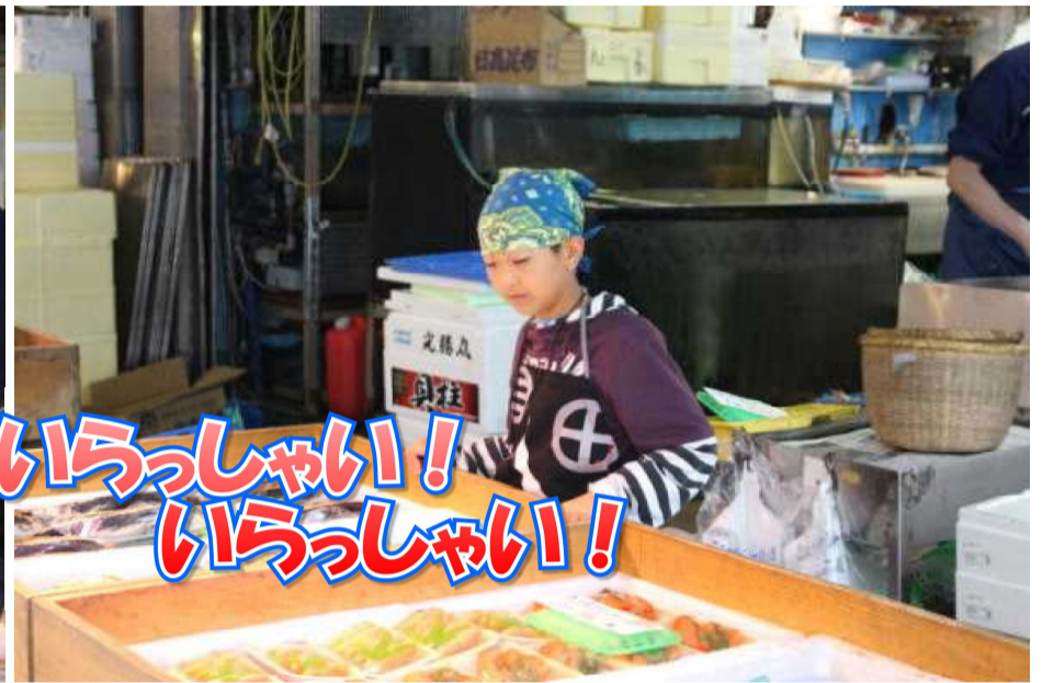
いらっしゃい！ いらっしゃい！