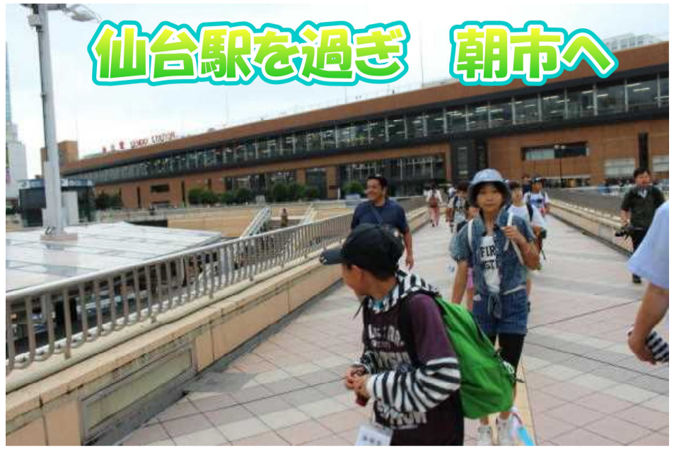
仙台駅を過ぎ 朝市へ