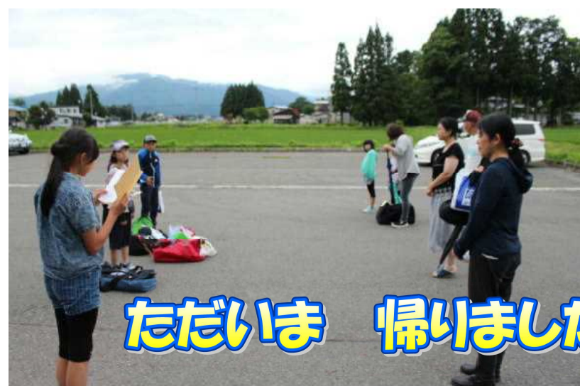
ただいま 帰りました