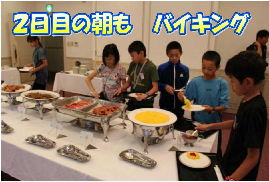
2日目の朝も バイキング